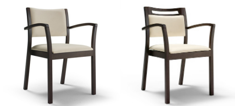
Iris 2001 sans poignée et avec poignée en bois dans le cadre du dossier