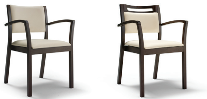
Iris 2001 sans poignée et avec poignée en bois dans le cadre du dossier